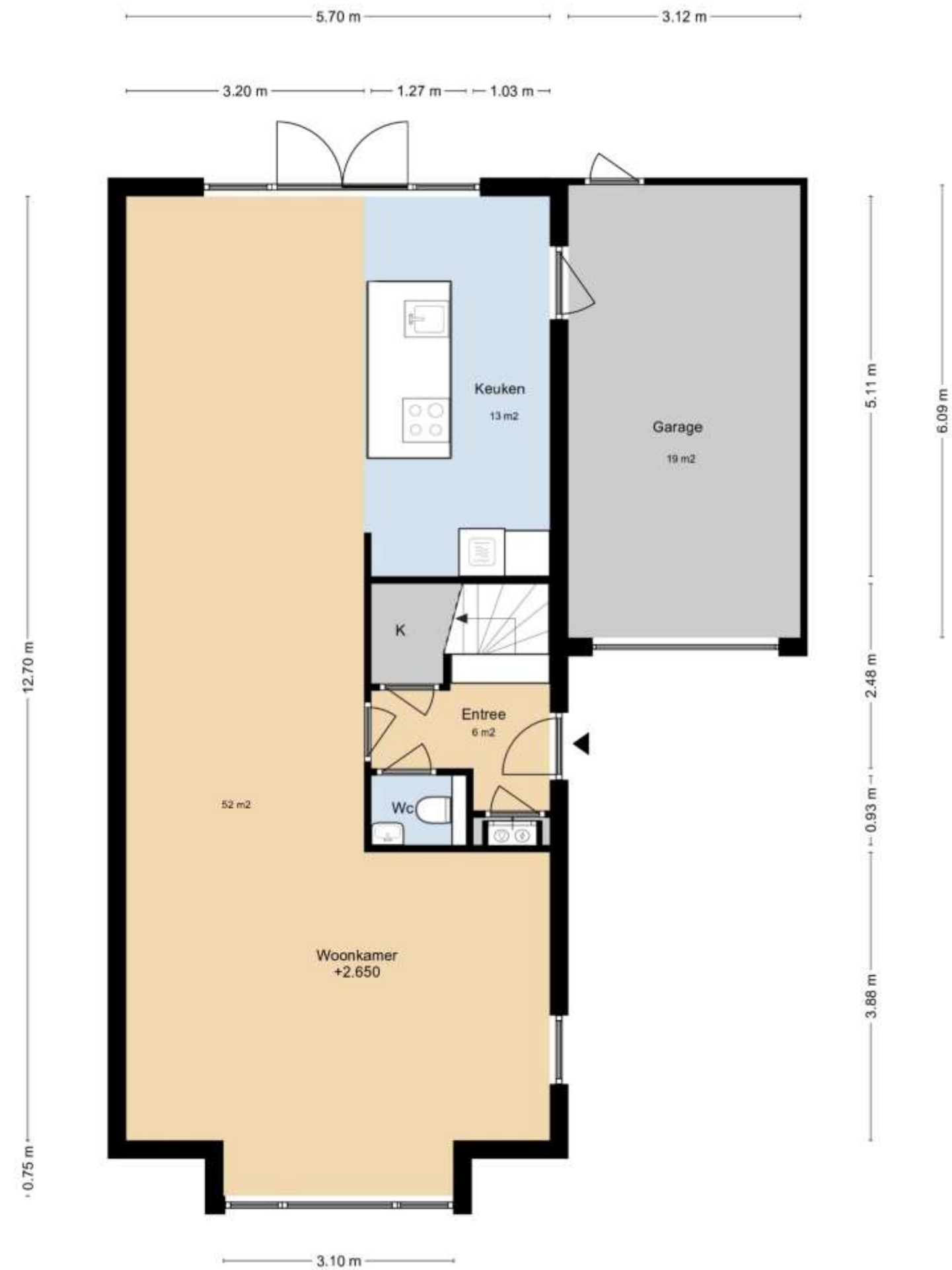
HOOG VELD 11 BEGANE GROND

DEZE PLATTEGRONDEN ZIJN MET DE GROOTSTE ZORG SAMENGESTELD EN DIENEN TER INDIICATIE. ER KUNNEN GEEN RECHTEN AAN WORDEN ONTLEEND.