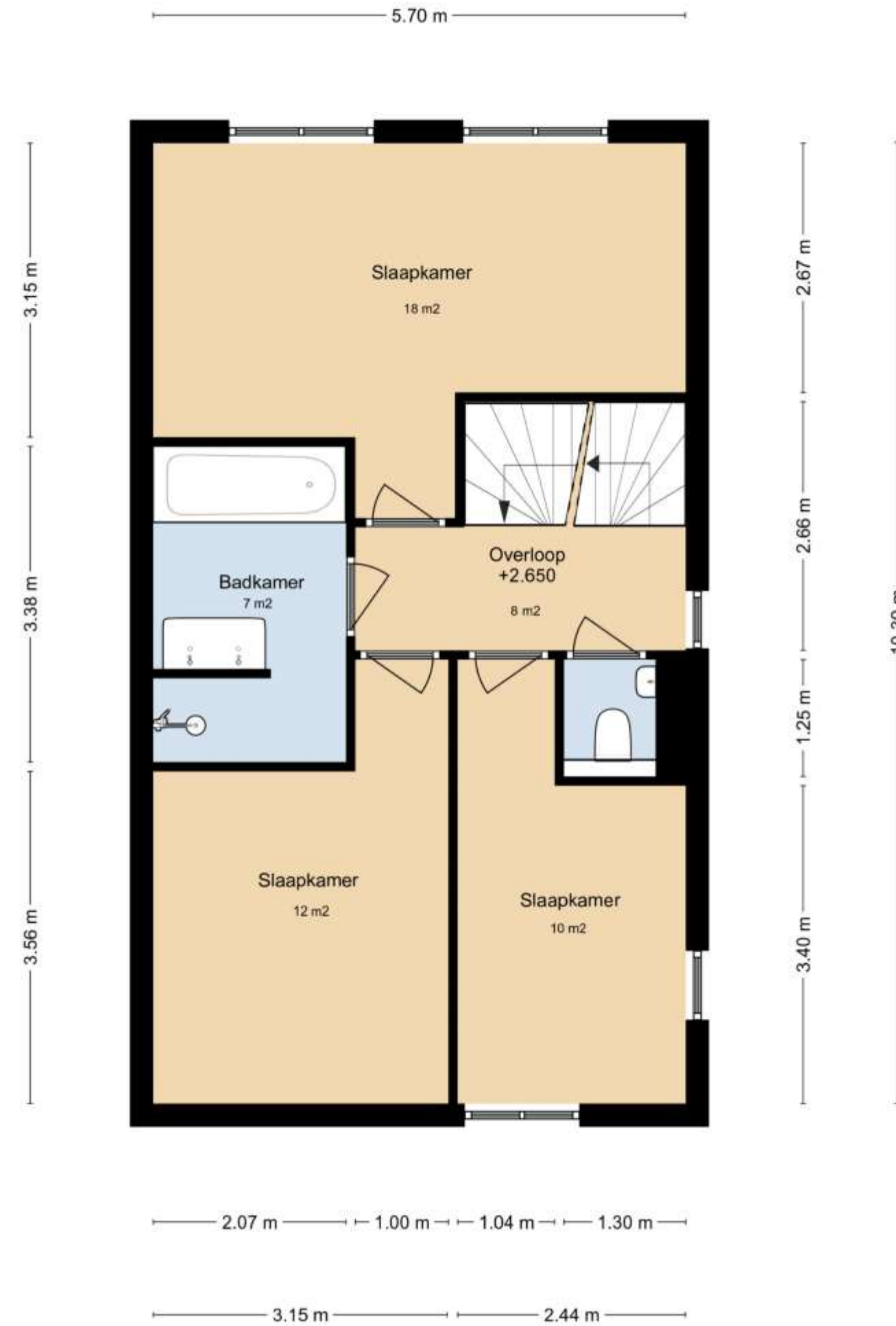
HOOG VELD 11 1E VERDIEPING

DEZE PLATTEGRONDEN ZIJN MET DE GROOTSTE ZORG SAMENGESTELD EN DIENEN TER INDIICATIE. ER KUNNEN GEEN RECHTEN AAN WORDEN ONTLEEND. © WWW.DROOMHUIS360.NL